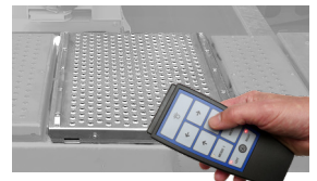
Gelenkspieltester mit Fernbedienung