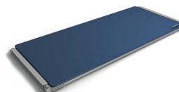
Plaques de débattement pour géométrie