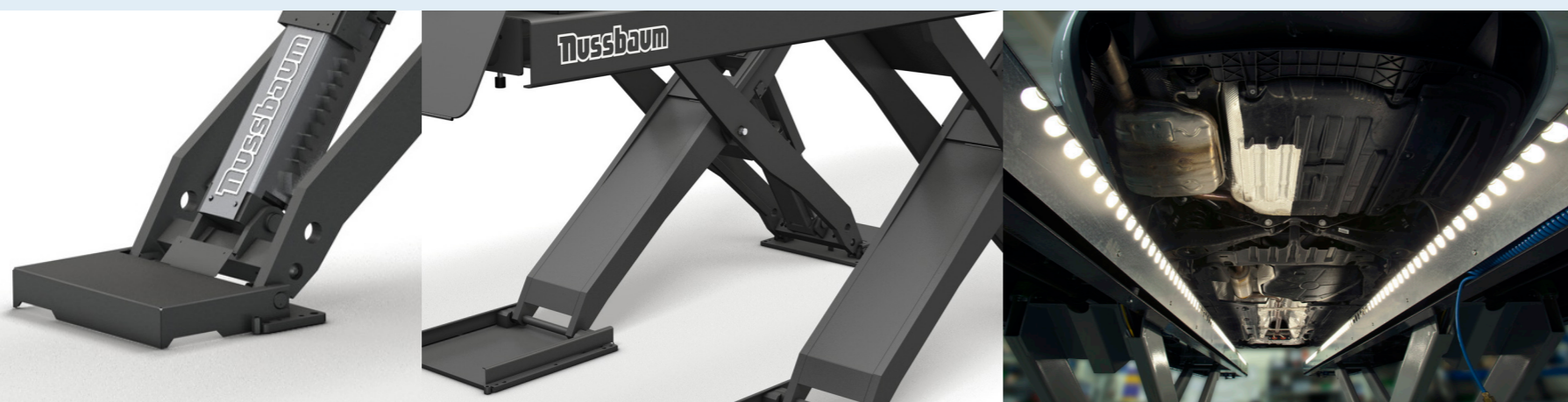
Crémaillère de sécurité

UNI LIFT 6500 ET 8000: LA SOLUTION IDÉALE POUR VL, VUL ET POIDS LOURDS LÉGERS