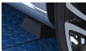
Pyramidenstumpf aus Gummi