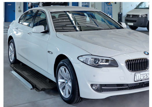
Sehr flache Konstruktion: Ideal für tiefliegende Fahrzeuge