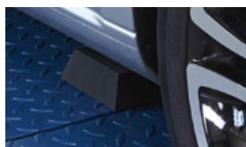
Pyramide en caoutchouc