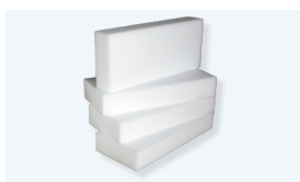
Supports en polymère 50x150x340 mm