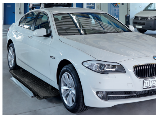
Construction très plate : idéale pour les véhicules surbaissés