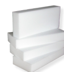
Polymerauflagen 50x150x340 mm