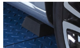
Pyramidenstumpf aus Gummi