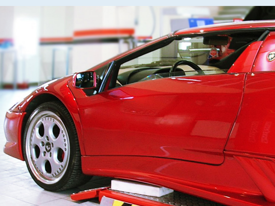
Sehr flache Konstruktion: Ideal für tiefliegende Fahrzeuge

JUMBO LIFT 3500, 4000: WIR BIETEN DIE RICHTIGE TRAGKRAFT FÜR JEDE WERKSTATT