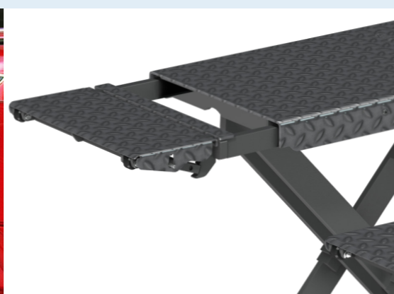
Neue maximale Länge von 2320 mm durch ausziehbare Verlängerungen. (Version X-Tend)