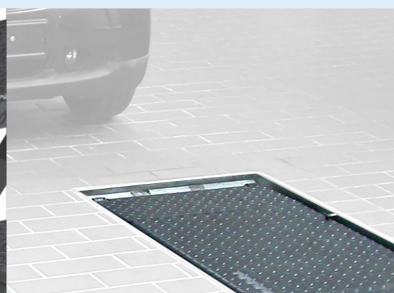
Bodenebener Einbau für tiefergelegte Fahrzeuge möglich, Idealerweise mit optionaler Einbauwanne