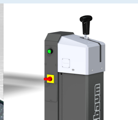
Der Nussbaum-Commander bietet variable Senkgeschwindigkeiten. (Version X-Tend)