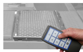
Prova giochi con telecomando