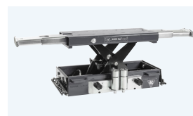
Jax 3200 / 4000