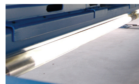
Sistema di illuminazione a LED